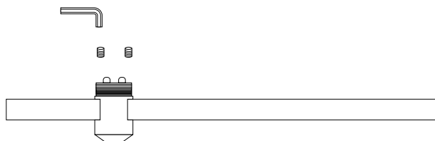
Рис. 2. Установка держателя на трек